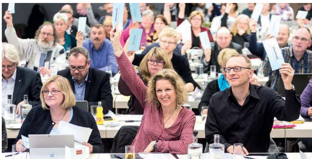
Die Bundestarifkommission beschließt am 14. Dezember 2016 in Berlin die Forderungen zur Tarif- und Besoldungsrunde 2017.

Die ver.di-Bundestarifkommission für den öffentlichen Dienst hat in ihrer Sitzung am 14. Dezember 2016 eine Forderung im Volumen von 6 Prozent für Tabellenerhöhungen und strukturelle Verbesserungen der Eingruppierung unter Berücksichtigung einer sozialen Komponente für die Tarif- und Besoldungsrunde 2017 mit der Tarifgemeinschaft deutscher Länder beschlossen.